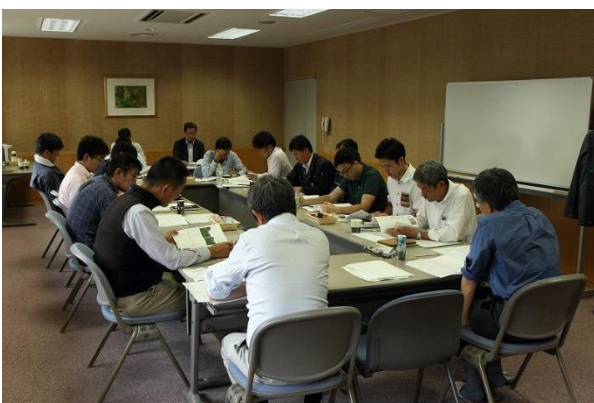
講義 課題発表 ディスカッション