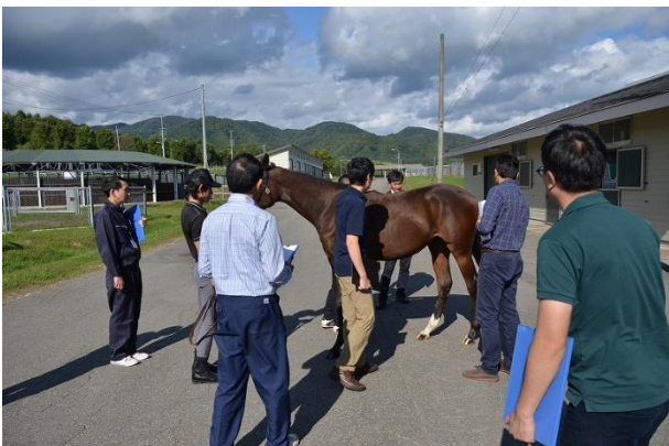
実技 ボディコンディション確認