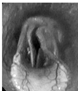
走行中の「喉頭片麻痺」

とはいえ獣医師にも、売買での判断が公正にできるような、内視鏡検査の適切な技術も必要です。異常に対しての予後や処置についての知識も必要です。購入希望者から意見を求められた場合には、データ、知識、経験をもとに何かしらのアドバイスをしなくてはなりません。