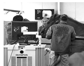
トレッドミル運動下での喉の内視鏡検査